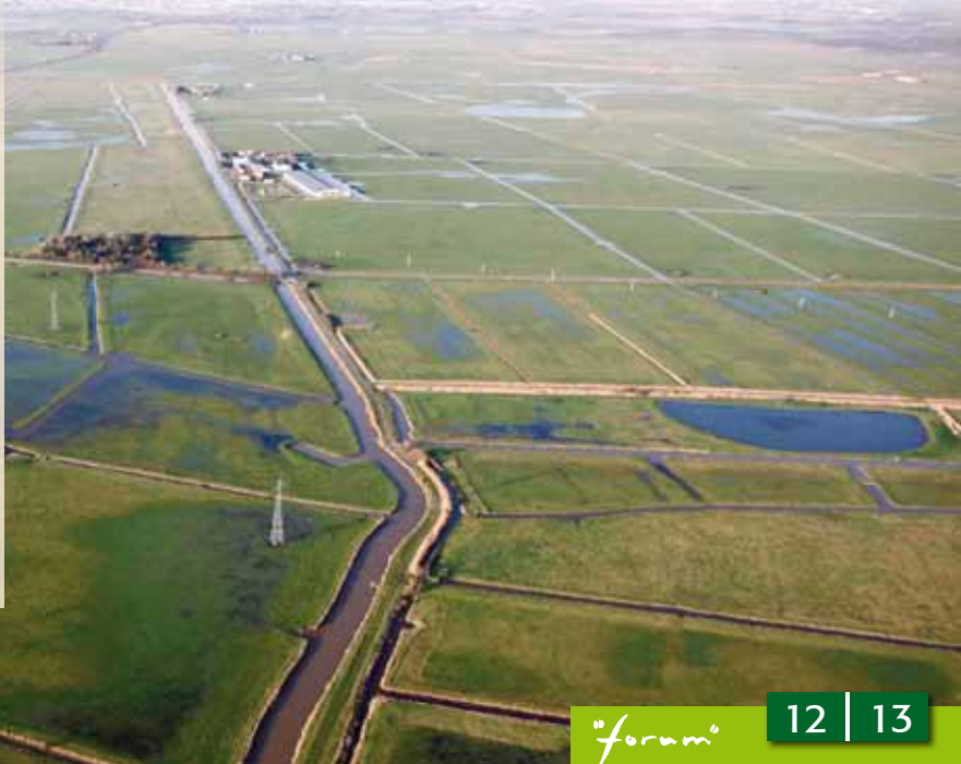
Photo aérienne du marais nord de Champagné

La mise en place de règles de gestion de l'eau dans le Marais poitevin est inscrite dans le SDAGE Loire-Bretagne 2010-2015 dans la disposition 7C4 « Gestion du Marais poitevin ». Les SAGE Lay et Sèvre Niortaise Marais poitevin ont chacun traduit cette disposition qui doit s'appliquer sur l'ensemble du Marais poitevin. Par ailleurs, le DOCOB du site Natura 2000 Marais poitevin prévoit également la mise en place d'une gestion dite agro-environnementale des niveaux d'eau. L'outil proposé par l'EPMP concourt donc à la mise en œuvre des objectifs du SDAGE, des SAGE et du DOCOB Natura 2000.